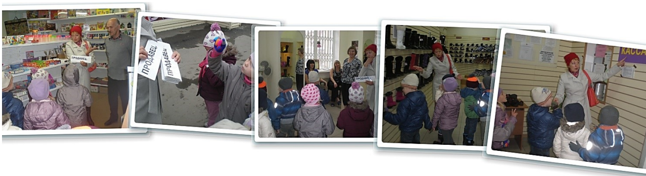
Рис. 4. Экскурсии в магазин

В основе искусствоведческих экскурсий лежат виды и жанры искусства: театральные, по народным художественным промыслам, в картинные галереи, выставочные залы, мастерские.