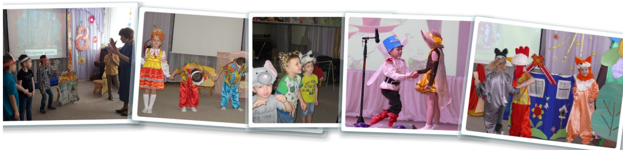
Рис. 7. Театрализованные представления воспитанников МКДОУ д/с № 311