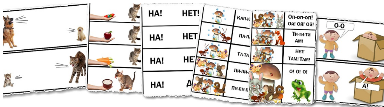
Рис. 10. Примеры логотомов, созданных и используемых педагогами МКДОУ д/с № 311

Наш вклад в «Логотомы» заключается в изготовлении подобных комплексов, но в цветном, красочном оформлении некоторых сюжетов, а также адаптация «Логотомов» под свои нужды в виде сказки (программные сюжеты сказок), потешек, база которых постоянно пополняется.