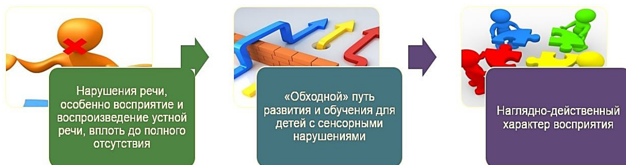
Рис. 1. Особенности развития ребенка при нарушении слуха

«Особые» дети разные, но каждый из них способен воспринимать и осмысливать этот мир, его взаимосвязи по-своему, способен строить отношения с социумом и свое личное благополучие, счастье. Это и называется социализация, позитивное отношение к миру. Пути достижения социализации у таких детей тоже особые. Где-то более медленные, сложные, требующие много сил и энергии. Где-то обходные, иные, не такие как у других детей.