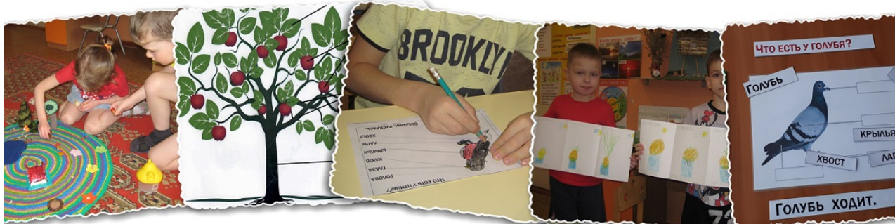
Рис. 3. Наглядный дидактический материал по экологическому воспитанию

Наглядность в детском саду для глухих детей представлена разными видами: предметы (непосредственно сами объекты наблюдения, исследования) – картинки (их изображения, как предметные, так и сюжетные) – схемы, модели (все менее имеющие сходство с натуральными и более схематичными) – таблички, письменная речь.