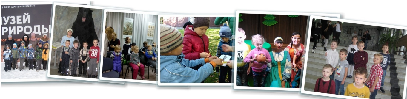
Рис. 5. Фотографии с экскурсий воспитанников МКДОУ д/с № 311

Природоведческие экскурсии закрепляют и расширяют знания, формируют научные представления о многообразии окружающей природы, а также преобразующей природу деятельностью человека. Доступно и наглядно преподносят основы экологических знаний и понятий. Самыми частыми объектами природоведческих экскурсий являются сквер Славы и Музей природы.