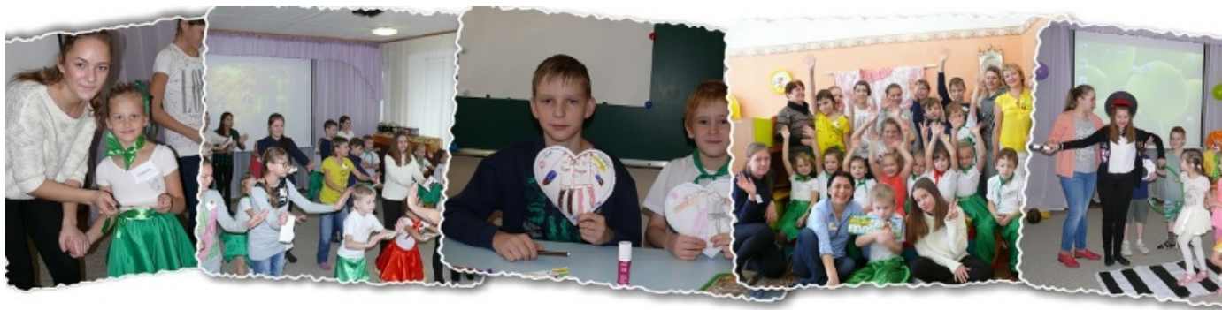
Рис. 8. Проект «Лесенка дружбы»

В результате проекта дети с нормальным развитием и слухом научились понимать глухих детей, получили некоторые знания о жестовом языке и навыки общения с помощью его, обогатились знаниями о различиях в физических возможностях людей. Все дети расширили круг общения и получили бесценный опыт взаимодействия. Воспитанники детского сада получили опыт общения с детьми, не имеющими нарушения слуха в обстановке продуктивного взаимодействия, вызывающего потребность пользования речью, расширили свои социальные контакты.