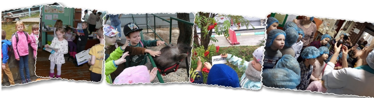
Рис. 6. Фотографии с экскурсий в зоопарк, библиотеку, парк и на шоколадную фабрику

Задачи педагогов непосредственно на экскурсии направлены на: