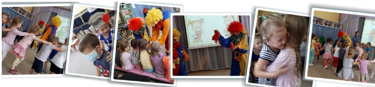
Рис. 9. Проект «Мы разные, но мы вместе!»